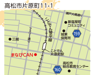
高松市 まなびCAN (高松市片原町)