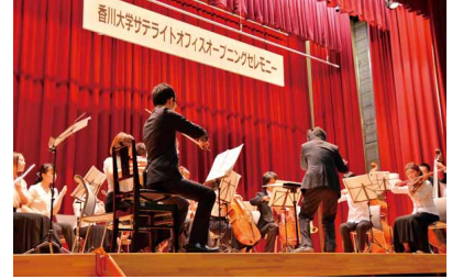
オープニングセレモニーの様子