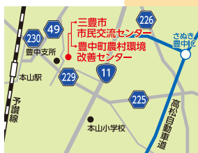
三豊市豊中町本山甲192-1