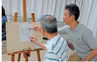
デッサン教室での一コマ