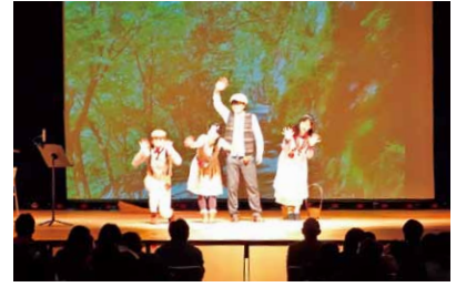
学生による演劇公演